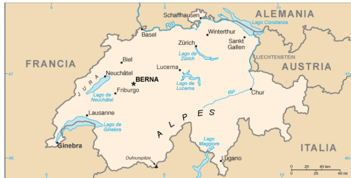
Figura 2: Map de Suiza

El paisaje suizo está caracterizado por los Alpes , una alta cadena montañosa que discurre a través de la zona central y sur del país. La parte del norte de Suiza, la más poblada, es más abierta, pero aún es medianamente montañosa. El clima suizo es normalmente templado, pero puede variar mucho dependiendo de la localidad, desde el severo clima en las altas montañas hasta el agradable clima mediterráneo en la parte sur.